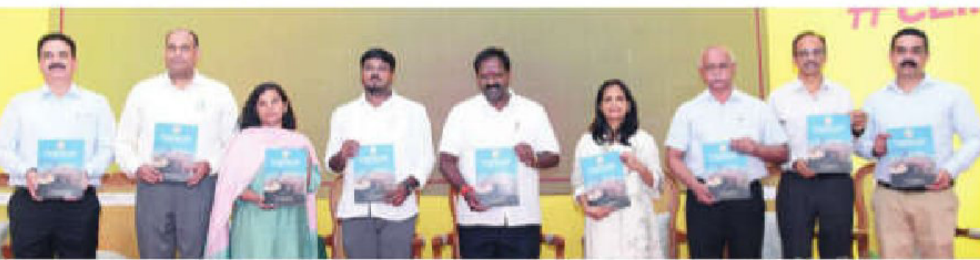
சென்னை கிண்டி சிறுவர் பூங்காவில் சுற்றுச்சூழல், காலநிலை மாற்றம் மற்றும் வனத்துறை சார்பில் நடைபெற்ற 'உலக சுற்றுச்சூழல் தின' விழாவில் 'தமிழகத்தில் பவளப்பாறை மறுசீரமைப்பு களப்பணியாளர்களுக்கான நிலையான செயல்முறை வழிகாட்டுதல்கள்' அடங்கிய புத்தகத்தை வெளியிட்ட வனத் துறை அமைச்சர் ஆர். வி. ரகுசீகமார், சுற்றுச்சூழல் மற்றும் காலநிலை மாற்றத் துறை அமைச்சர் வி.கே.ராஜீவ் உள்ளிட்டோர்.

இது குறித்து மெட்ரோ ரயில் நிறுவனம் வெளிக்கிழமை வெளியிட்ட செய்திக் குறிப்பு: சென்னை மெட்ரோ ரயில் போக்குவரத்தில் 2-ஆவது வழித்தட பணிகள் விரைவாக நடைபெற்று வருகின்றன. அதில் 5-ஆவது வழிப்பாதையானது, ஆதம்பாக்கம் உள்நிலைப் பகுதிகளில் செல்கிறது. அப்பாதைக்கான 19.5 மீட்டர் நீளமுள்ள காள் கிரீட் தூண் 'யூ' வடிவ தூண் (கார்டர்) தயாரிப்புப் பணி தற்போது நிறைவு