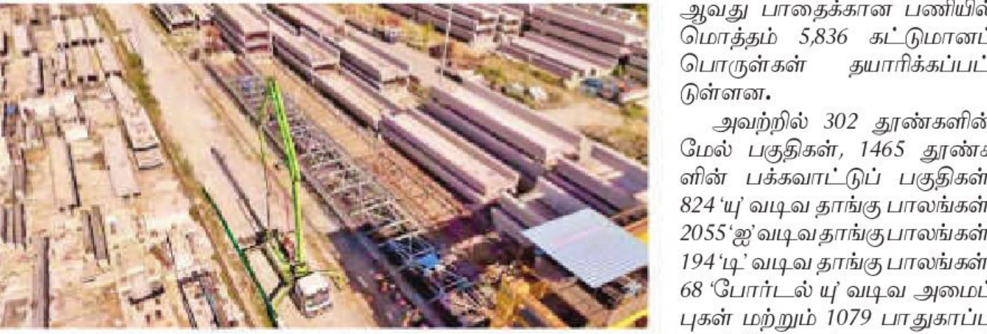
சென்னை மெட்ரோ ரயில் நிலையக் கட்டுமானப் பணிகளுக்கு தேவையான பிரம்மாண்டமான காள் கிரீட் பாகங்களை தயாரிக்கும் இடம்.